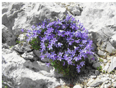
Slika 2. Campanula portenschlagiana Roem. et Schult.