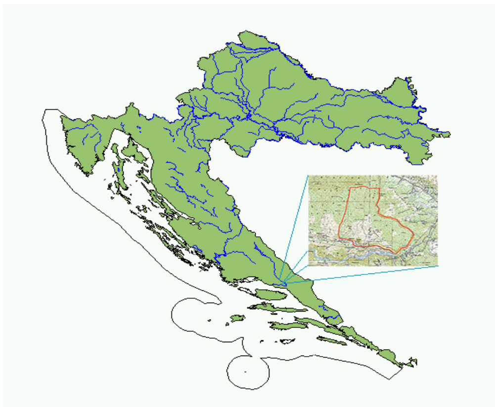
Slika 1. Geografski smještaj istraživanog područja Šćadin.